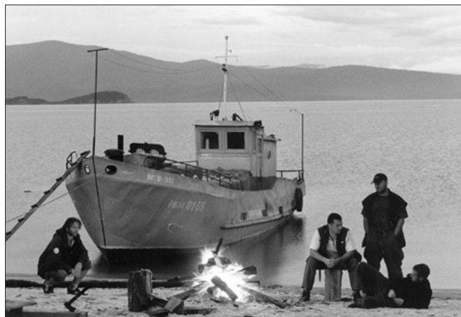
Na pláži v Kurbuliku.

Věděli jste že, při útoku na Kavkaz německými vojsky v roce 1942 byl horskými myslivci pokořen vrchol a byla na něm vztyčena říšská vlajka s hákovým křížem? Nebylo to však zadarmo. Němci se museli utkat s místní posádkou a výstup na vrchol se jim kvůli špatnému počasí podařil až napotřetí. Rusům se pak povedlo německou vlajku sundat v únoru 1943. U horní stanice lanovky stojí památník obětem těchto bojů.